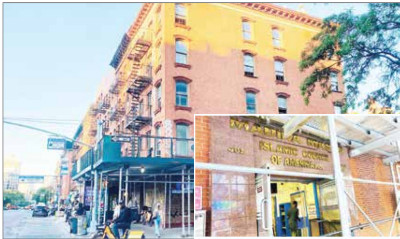
নিউইয়র্কে ৪ যুগ ধরে বাংলাদেশী কমিউনিটির ল্যান্ডমার্ক হিসেবে স্ব-গৌরবে দাঁড়িয়ে আছে 'মদিনা মসজিদ'। ইনসেটে মসজিদের প্রবেশমুখ।

শাহ সুমন: নিউইয়র্কের ব্যস্ততম এলাকা ম্যানহাটন। সেখানকার ডাউনটাউনের ইস্ট ভিলেজ ফার্স্ট অ্যাভিনিউয়ে ১১ স্ট্রিটের কর্ণারে অবস্থিত ইসলামিক কাউন্সিল অব আমেরিকা যেটি মদিনা মসজিদ নামে পরিচিত। এ মসজিদটি ৪ যুগ ধরে বাংলাদেশী কমিউনিটির ল্যান্ডমার্ক হিসেবে নিউইয়র্কে এখনো দাঁড়িয়ে আছে স্ব-গৌরবে। ১১ স্ট্রিটে অবস্থিত মদিনা মসজিদের সামনে সারিবদ্ধভাবে ডেলিভারি কর্মীদের স্কুটি-বাইক রাখা। মসজিদের ভিতরে ফুড ডেলিভারি ও পার্সেল ডেলিভারি কর্মীরা কেউ কেউ ক্লাস্তি কাটাতে বিশ্রাম নিচ্ছেন। আবার কেউ কেউ সেখানে ওয়ু করে নামাজে দাঁড়িয়েছেন। কেউ আবার নামাজ শেষে মসজিদের কার্পেটে ক্লাস্ত দেহ নিয়ে ঘুমিয়ে পড়েছেন। শুধু (বাকি অংশ ২২ এর পাতায়)