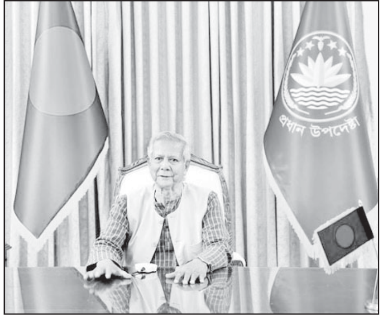
অন্তর্বর্তী সরকারের প্রধান উপদেষ্টা ড. মুহাম্মদ ইউনূস ১১ সেপ্টেম্বর জাতির উদ্দেশ্যে ভাষণ দেন

বাংলাদেশ সশস্ত্র বাহিনীর সকল সদস্যকে আমি ধন্যবাদ জানাই তাদের সততা, ত্যাগ ও অসীম দেশপ্রেমের জন্য। দেশের স্বাধীনতা সংগ্রাম থেকে শুরু করে বন্যা, খরা, বড়, বৃষ্টি, ঘূর্ণিঝড় সহ সকল প্রাকৃতিক দুর্ভোগে আপনারা সকলের শেষ ভরসার স্থান। দেশের প্রতিটি ক্রান্তিলগ্নে আপনারা দেশের মানুষের পাশে থেকেছেন। দেশের স্বাধীনতার পক্ষে, সার্বভৌমত্বের পক্ষে অবস্থান নিয়েছেন। দেশ গঠনেও আপনারা সবার আগে এগিয়ে এসেছেন। বিগত জুলাই হতে শুরু হওয়া গণ অভ্যুত্থান, বন্যা, নিরাপত্তা প্রদান, অস্ত্র উদ্ধার সহ সকল কার্যক্রমে আপনারা সফল ভাবে দিনরাত কাজ করে যাচ্ছেন। সরকার ও জনগণের পক্ষ থেকে আসি আপনাদের প্রতি অনেক কৃতজ্ঞতা জানাচ্ছি। বন্যা আমাদের জনজীবনে আরেকটি দিক