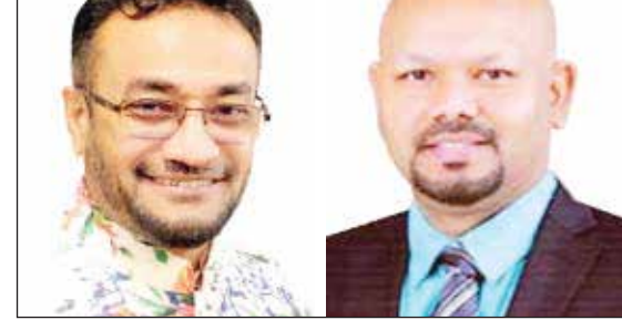
'মাকসুদ-মাসুদ' প্যানেলের সভাপতি ও সাধারণ সম্পাদক প্রার্থী

বাংলা পত্রিকা রিপোর্ট: চট্টগ্রাম এসোসিয়েশন অব আমেরিকার (চট্টগ্রাম সমিতি) আসন্ন নির্বাচনে কার্যকরী (বাকি অংশ ২ এর পাতায়)