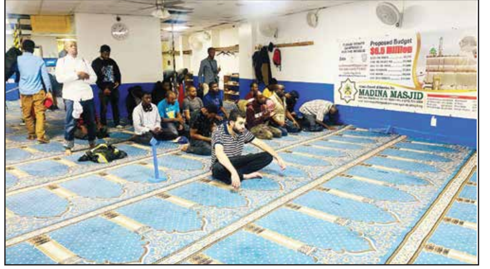
মসজিদে গিয়ে নামাজ আদায় করছেন মুসল্লিরা। আর কেউ কেউ ক্লান্ত কাটাতে নামাজ শেষে বিশ্রাম নিচ্ছেন