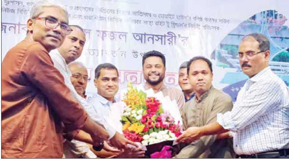
(প্রথম পাতার পর) উল্লেখ করেন। অনুষ্ঠানে প্রধান অতিথি ছিলেন বিএনপির মহাসচিব মির্জা ফখরুল ইসলাম আলমগীর। এছাড়াও অনুষ্ঠানে বিভিন্ন রাজনৈতিক ও অরাজনৈতিক দলের নেতৃবৃন্দ অতিথি হিসেবে উপস্থিত ছিলেন। শুক্রবার (১৩ সেপ্টেম্বর) বিকেলে বিএনপি চেয়ারপারসন ও সাবেক প্রধানমন্ত্রী বেগম খালেদা জিয়ার