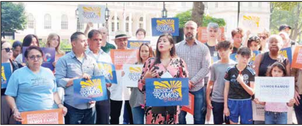
(প্রথম পাতার পর) দুঃখকষ্ট, প্রত্যাশা প্রাপ্তি ও সম্ভাবনা কি? তিনি আরো বলেন, সিটির গুরুত্বপূর্ণ ইস্যু নিয়ে স্টেট সিনেটে যথাসাধ্য ভূমিকা রেখেছেন। তার বিশ্বাস নিউইয়র্ক শহরের নাগরিকরা তাকেই আগামী মেয়র হিসেবে দেখতে চায়। এসময় ভারতীয় ও স্প্যানিশ কমিউনিটি সহ অন্যান্য কমিউনিটির প্রতিনিধিরা উপস্থিত ছিলেন।