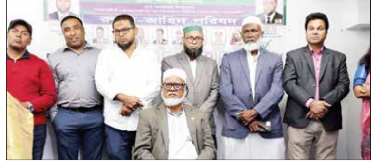
'রুহুল-জাহিদ' প্যানেলের পরিচিতি সভায় নেতৃবৃন্দরা

'নির্বাচিত হলে কমিউনিটি ভবন তৈরির আশ্বাস'