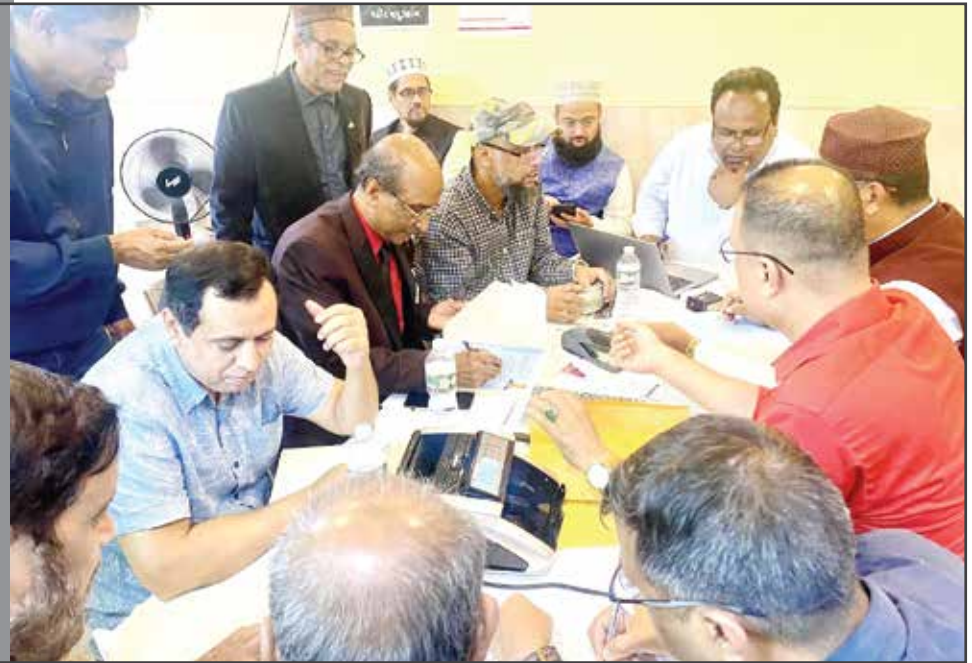
‘তাহের-আরিফ’ প্যানেলের মনোনয়ন দাখিল