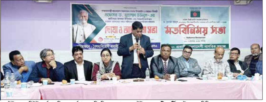
বৈষম্যবিরোধী প্রবাসী ও নাগরিক সমাজ-এর ব্যানারে অন্তর্বর্তীকালীন সরকারের প্রধান উপদেষ্টা ড. মুহাম্মদ ইউনূসকে নিউইয়র্কে নাগরিক সংবর্ধনার প্রস্তুতি বিষয়ে জ্যাকসন হাইটসের একটি পার্টি সেন্টারে মতবিনিময় সভা করেন।